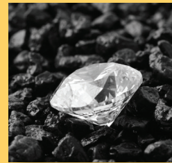
Abb. 2 Brillant

Neben der Verwendung als Schmucksteine werden Diamanten in der Industrie als Bohr-, Schleif- oder Schneidwerkzeuge verwendet. In der Medizin gibt es diamantbesetzte Skalpelle.